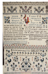
Wandschützer der Familie Leitert

AUFGABE: Was erzählt der Wandschützer über die Hartauer Familie, deren Wand er schmückte? Erfahre mehr über sie, indem du die original gestickte Chronik im Heimatmuseum in Hartau liest!