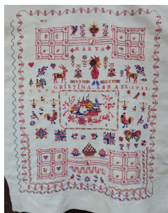
Wandschützer der Familie Arrasz