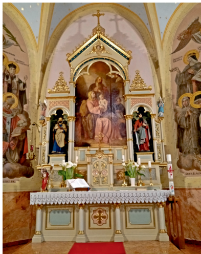
A templom főoltára

Az 1780-as évekre a falu lélekszáma elérte a 400 főt, ezért felmerült a község nagyságához méltó, tágas templom építésének igénye. A királyi engedélyt 1779-ben megkapták, 1785-re a földesúri pártfogást és a telket is megszerezték.