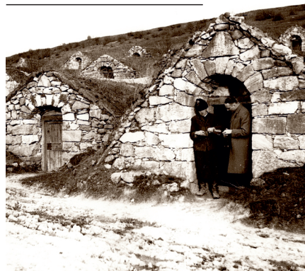
Pincék az 1937-ben készült fotón

Vincellér szőlőmunkásokkal a borbáz udvarán 1933-ban