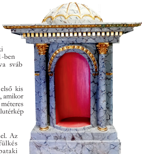
A kápolna tabernákuluma

A kápolna elé egy kőfeszületet is állítottak. Mai utódját a kertből közterületre helyezték át, s rajta az elbontott korábbi feszület állításának 1836-os évét és az „Értünk halt meg!” feliratát megörökítették.