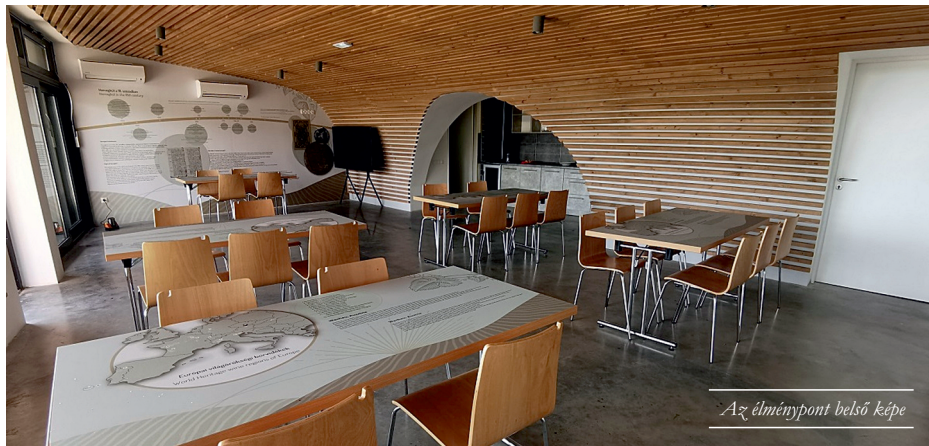
Az élménypont belső képe

A látogatóközpont lebetűve teszi a Kőporosi-pincsort meglátogató vendégek és érdeklődők korszerű és színvonalas kiszolgálását, borkóstolások, kulturális és gasztronómiai rendezvények lebonyolítását. A borterasztát a helyi borászok is igénybe veszik kóstolóik alkalmával, ugyanis a legtöbb pince nem alkalmas arra, hogy 40-50 fős vendégsereget leültesse.