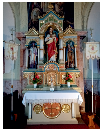
A Jézus Szíve oltár

A helyi közösség vallási életének ma is fontos színtere a templom. Önálló plébánia működik, helyben lakó plébános vezetésével.