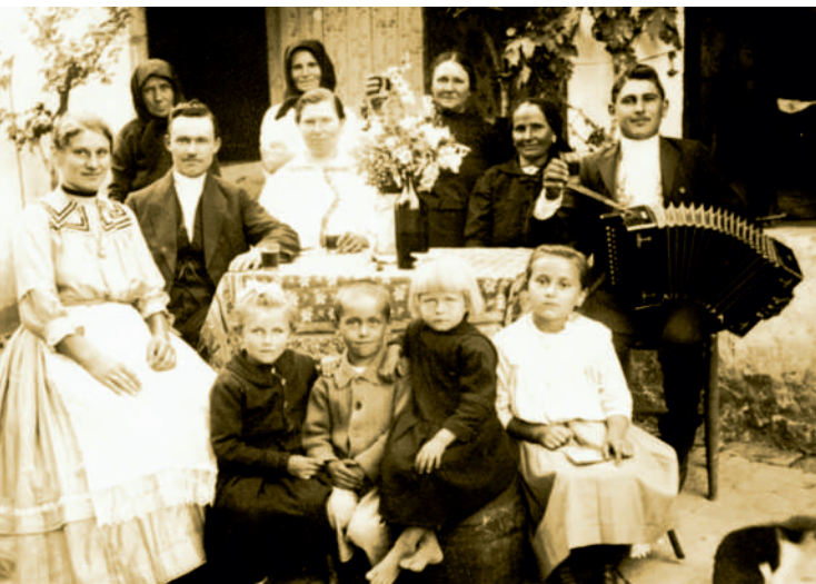
MOHÁCSI NÉMET KÉZMŰVES CSALÁD 1900 KÖRÜL